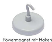
Powermagnet mit Haken