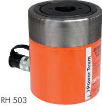
Typ RH 503