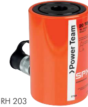
Typ RH 203