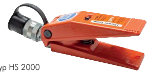
Typ HS 2000